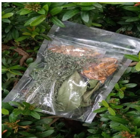
Gambar 3. Produk Setengah Jadi